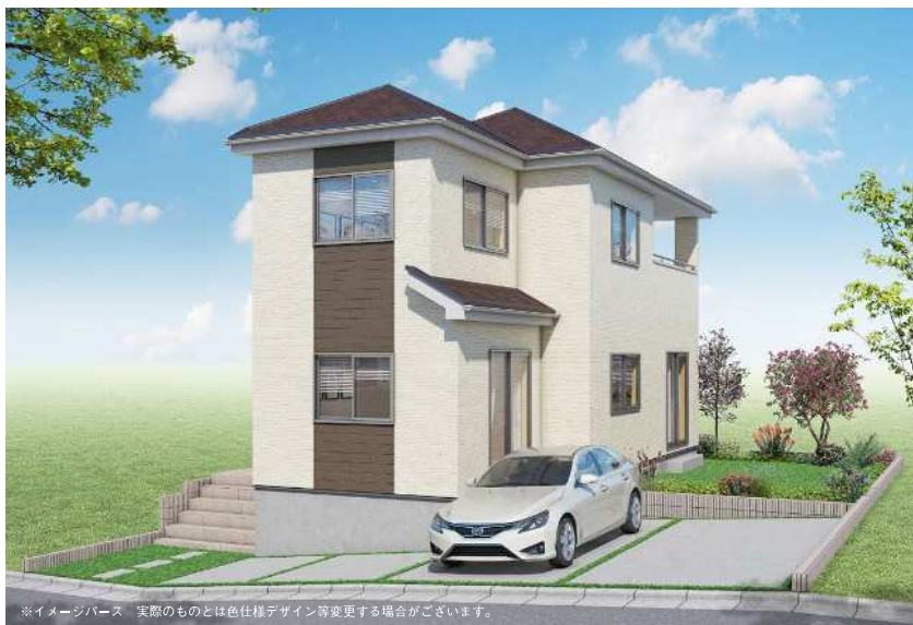
※イメージベース。実際のものとは色仕様デザイン等変更する場合がございます。